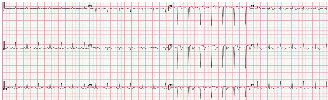
图1 患者入院时心电图(说明见正文)

讨论 急性心肌梗死(Acute myocardial infarction, AMI)的典型症状表现为持续性胸骨后压榨样疼痛或心前区疼痛,休息或舌下含服硝酸甘油后上述症状不缓解。不典型症状可表现为多种,疼痛部位不典型,有消化不良、呕吐、头晕、疲劳、牙痛、咽喉不适、剑突下疼痛、下颌疼痛、腹痛 [1-3] 和间歇性